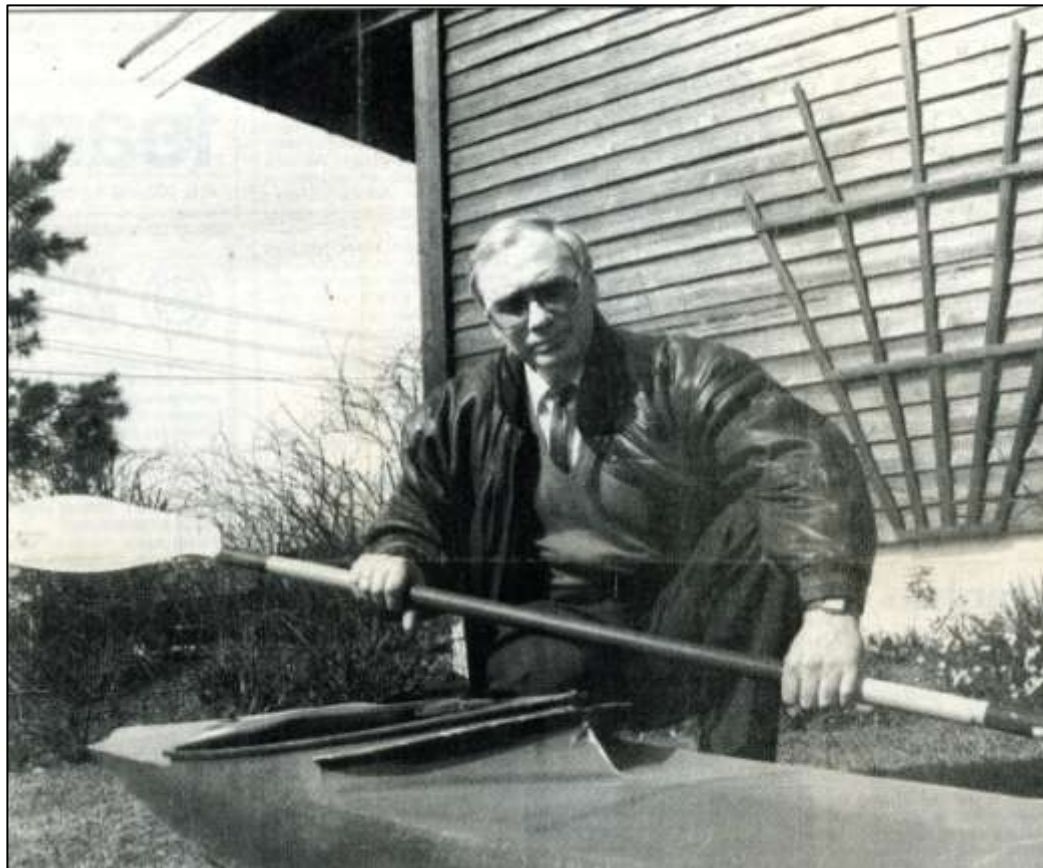
1988 hjemme i Vestskogen på Nøtterøy

— Det første seniorgullet husker jeg godt. Det var jeg med på å vinne i 1954, da Tønsberg vant stafetten. Og i løpet av den aktive perioden, som varte frem til 1973, ble det tilsammen seks kongepokaler og 42 NM-titler.