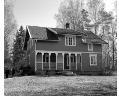
Det gamle klubbhuset – tidligere Berg Olsens båtbyggeri, og Barneskjær med så mange gode minner