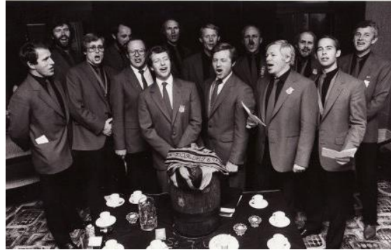
St. Jockumus Orden ved 50-årsjubileet i 1985

I arv fra tidligere generasjoners turpadlermiljø gir de stadig kraft og fylde til den gamle padlersangen til den russiske folkemelodien Stenka Razin: